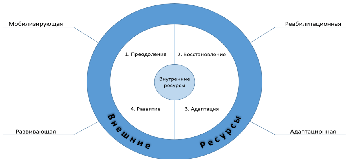
Рисунок 2 – Структурно-функциональная модель резильентности

Структурно-функциональная модель резильентности не только отражает конструкты и слагаемые, но и вскрывает их связи с выполняемыми функциями. Представленная нами модель при выявлении новых знаний в теории и практике резильентности может дополняться. Данная структурно-функциональная