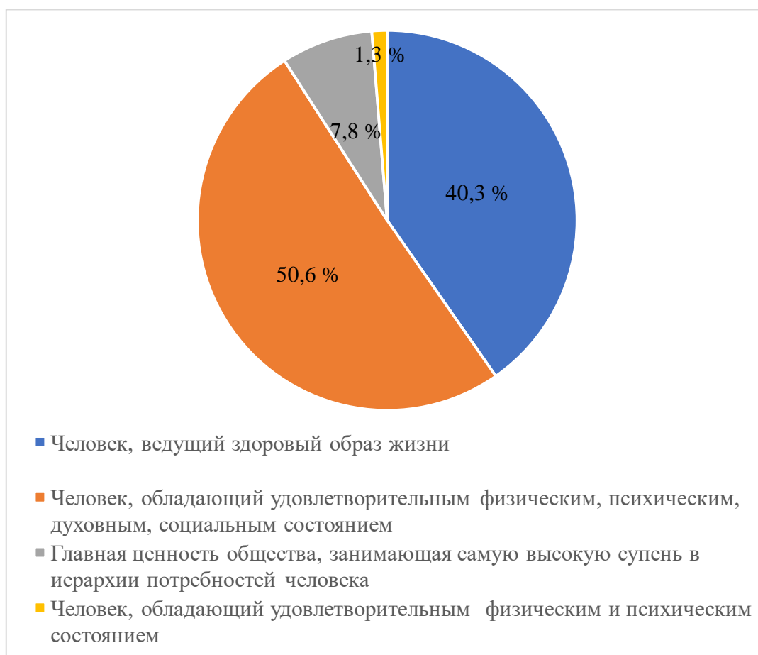
Рисунок 1 – Диаграмма ответов респондентов на вопрос «Здоровый человек – это..?»

При ответе на вопрос о соотношении понятий «культура здоровья» и «безопасность общества» респондентам предлагалось выбрать утверждение, наиболее им подходящее. Большинство из отвечавших (73,3 %) выбрали утверждение «культура здоровья – это составляющая часть безопасности общества»; 9,3 % – «здоровое общество равно безопасному обществу»; утверждение «два феномена, не связанные друг с другом» – 17,4 % (ими стали